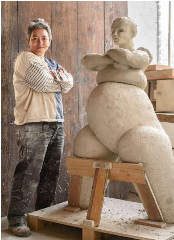
© David VENIER - Université Jean Moulin Lyon 3

Ma pratique artistique a commencé avec le dessin, principalement le modèle vivant. Je dessine au trait les corps en mouvement, en énergie, au crayon, à l'encre de chine.