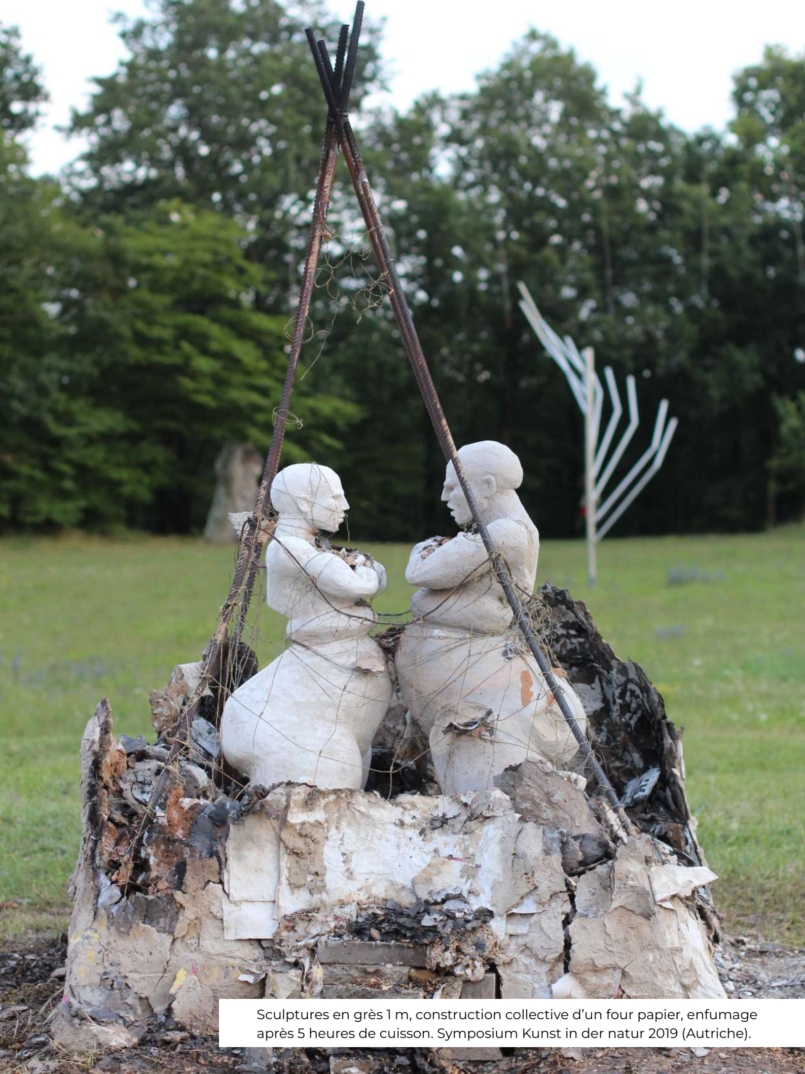
Sculptures en grès 1 m, construction collective d'un four papier, enfumage après 5 heures de cuisson. Symposium Kunst in der natur 2019 (Autriche).