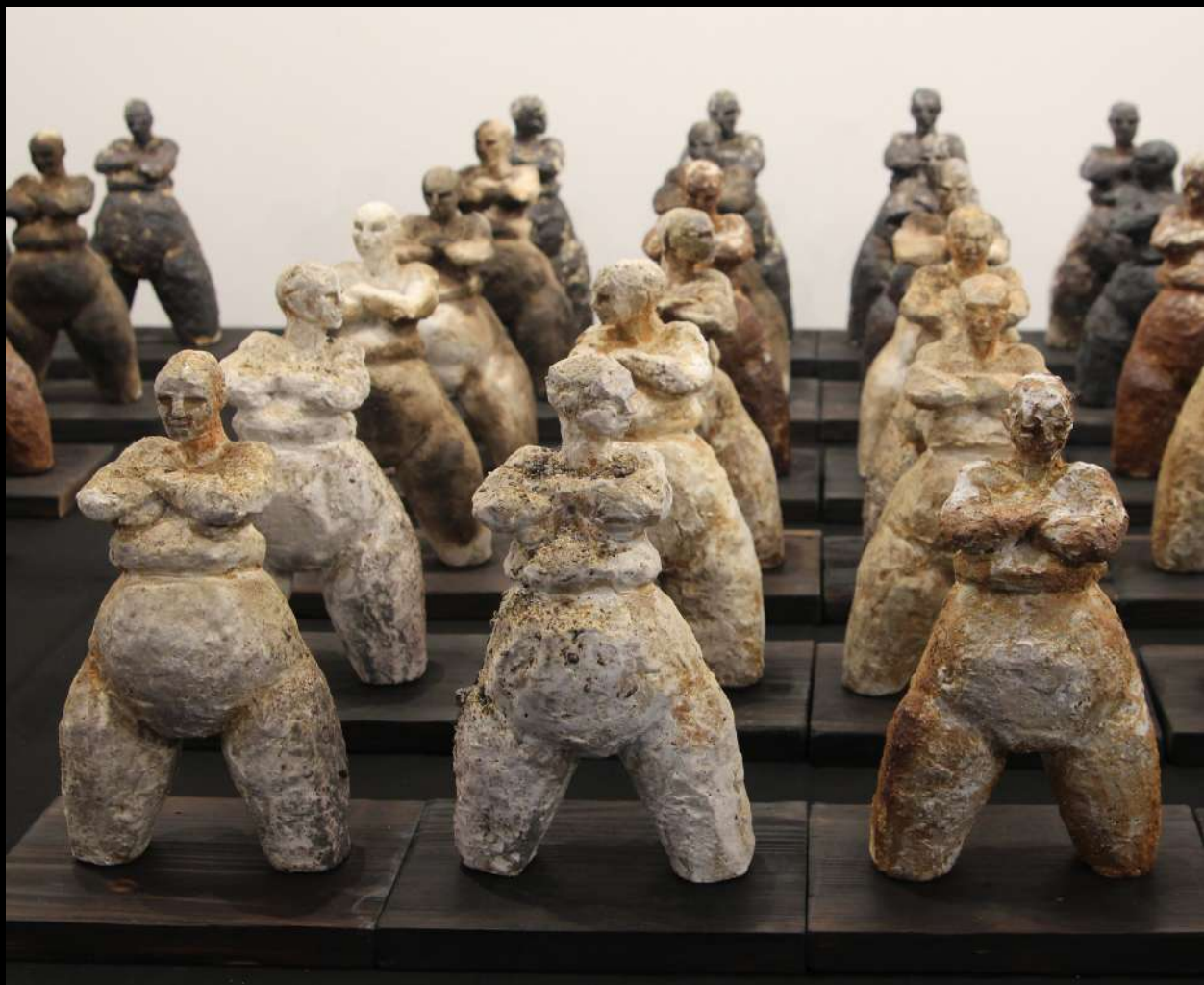
Armées de terre cuite Ensemble de sculptures d'environ 25 cm grès engobés, cuisson bois, raku et gaz