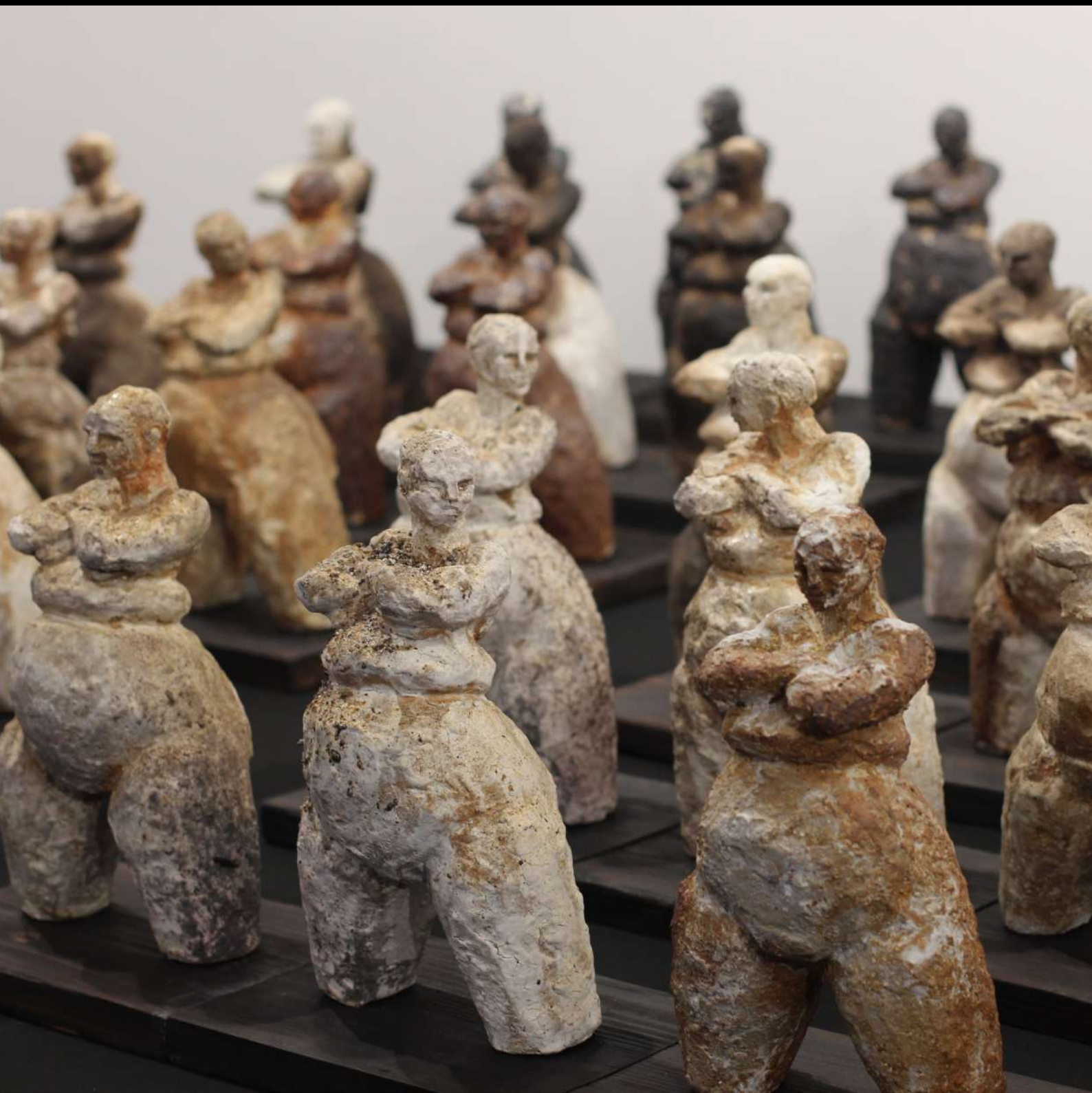
Armées de terre cuite Ensemble de sculptures d'environ 25 cm grès engobés, cuisson bois, raku et gaz