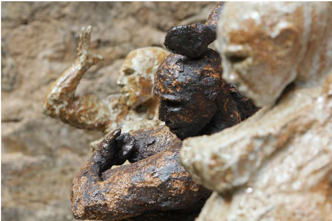
Sculptures 60 cm, grès engobés, cuisson bois