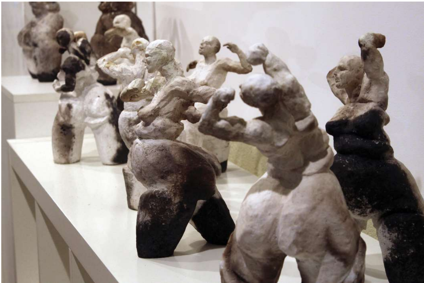
Sculptures 30 cm, grès engobés, enfumage après cuisson raku