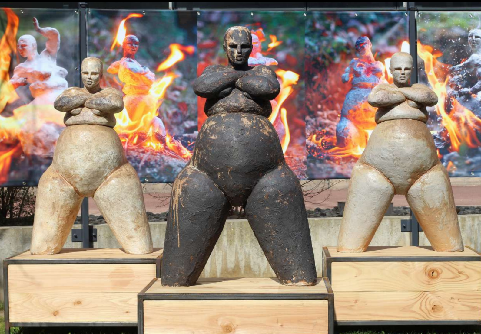
Sculptures 140 et 125 cm, grès engobés, cuisson bois Photos sur bache